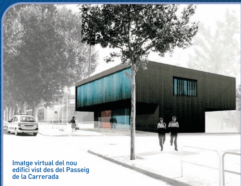
Imatge virtual del nou edifici vist des del Passeig de la Carrerada