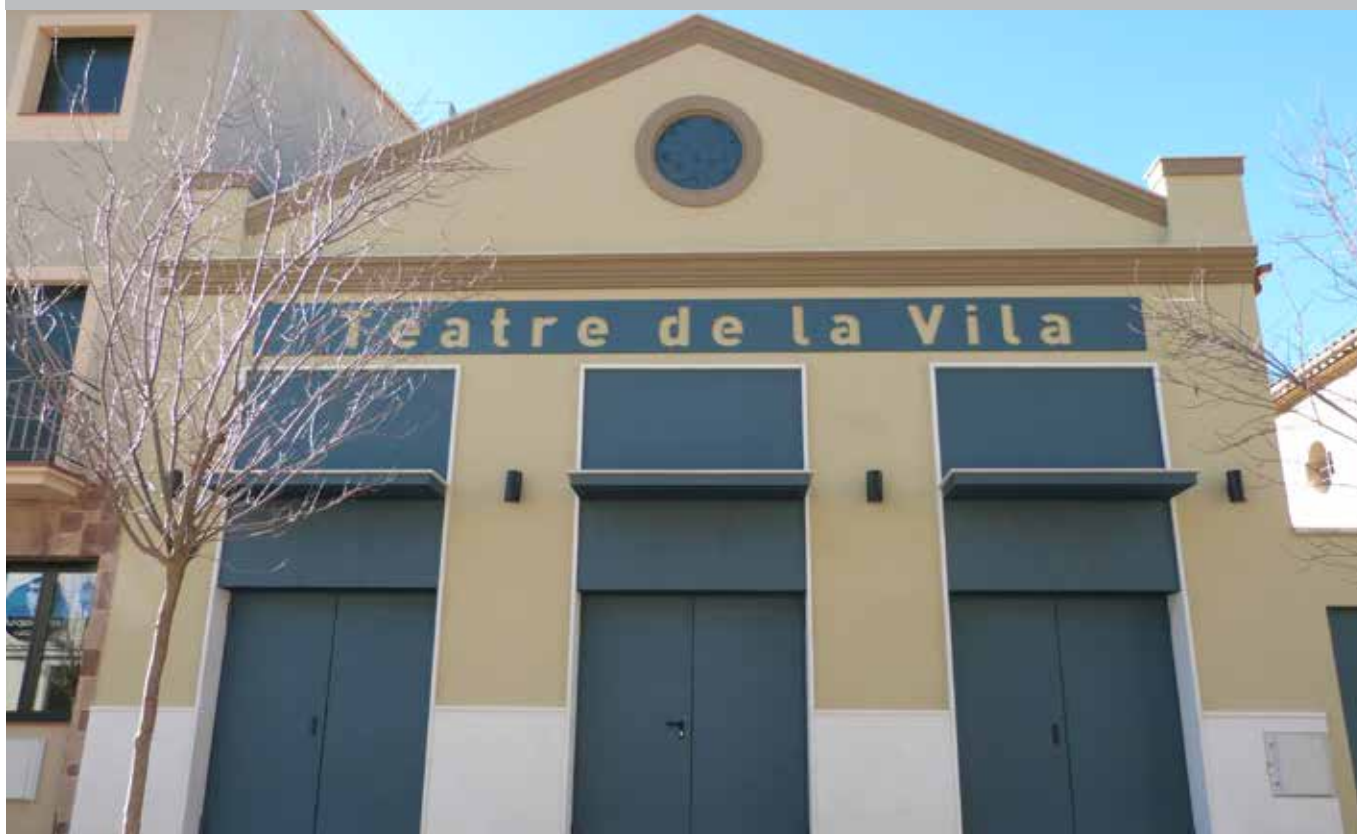
Rehabilitació del Teatre de la Vila i reformes a la Sala Polivalent