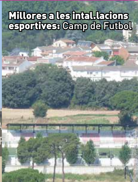
Millores a les instal·lacions esportives: Camp de Futbol