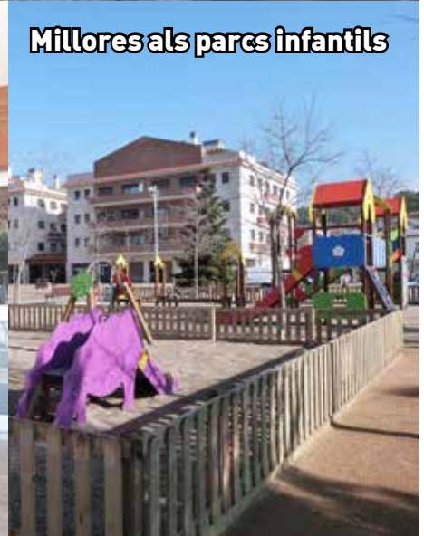
Millores als parcs infantils