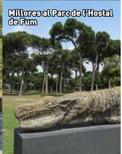
Millores al Parc de l'Hostal de Fum