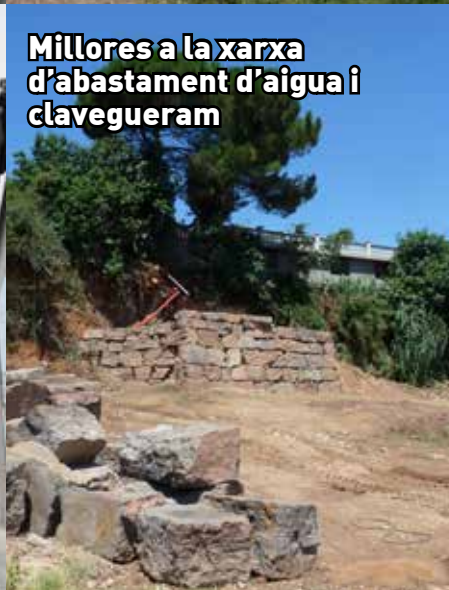
Millores a la xarxa d'abastament d'aigua i clavegueram