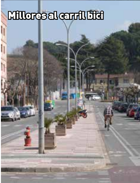
Millores al carril bici