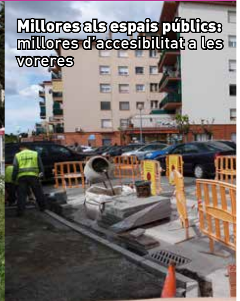
Millores als espais públics: millores d'accessibilitat a les voreres