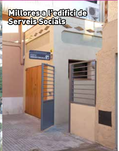
Millores a l'edifici de Serveis Socials