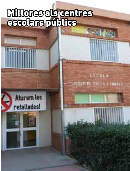
Millores als centres escolars públics