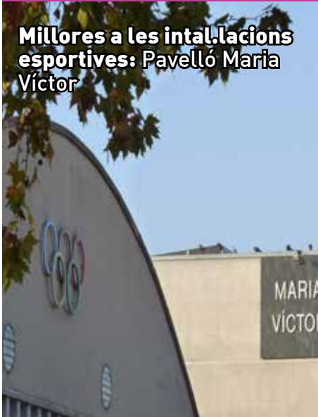
Millores a les instal·lacions esportives: Pavelló Maria Víctor