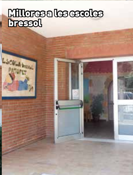
Millores a les escoles bressol