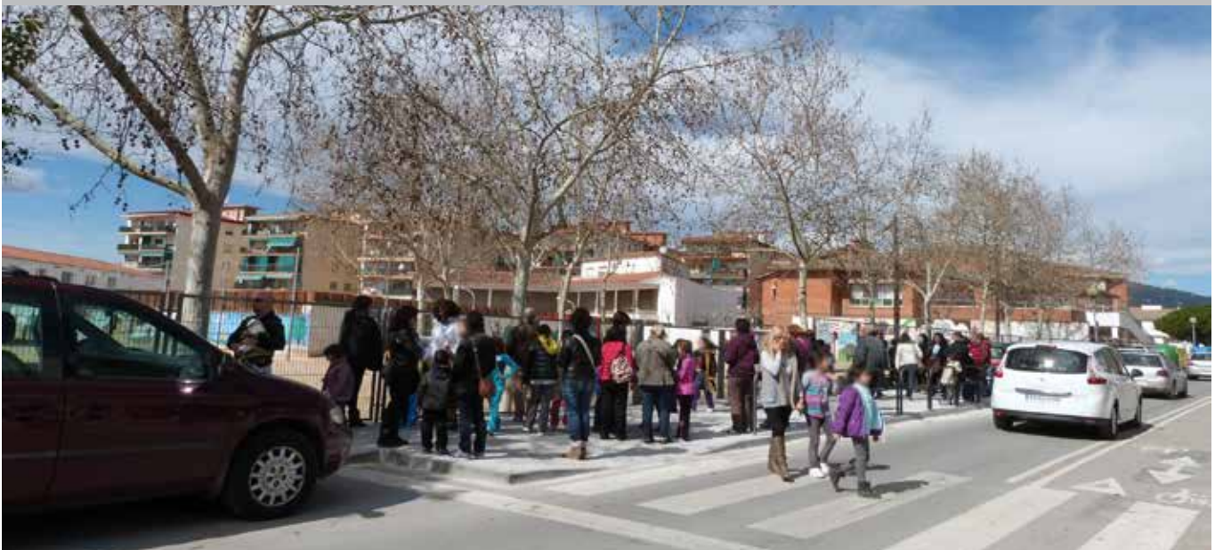
Millores en l'espai públic dels barris.