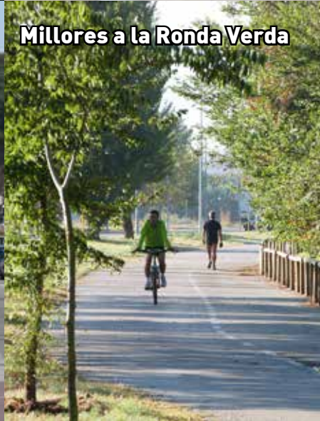
Millores a la Ronda Verda