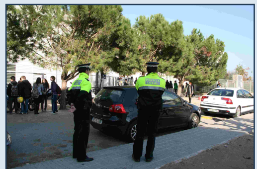
Dos agents patrullen a l'hora del pati a l'institut

Els agents de la Policia Local participen en un cicle sobre gent gran i seguretat, junt amb els Mossos d'Esquadra. La primera activitat d'aquest cicle ha estat una xerrada al Casal de la Gent Gran sobre com prevenir estafes i furts. Un agent de la Policia Local i un altre dels Mossos d'Esquadra van advertir de forma especial sobre grups organitzats que es fan passar per treballadors d'empreses de manteniment de serveis, com el gas o l'electricitat, o fins i tot de l'àmbit sanitari per accedir a les llars i estafar o robar. El consell bàsic que van donar els agents és ser prudent i desconfiar davant els desconeguts i trucar la policia en cas de detectar actuacions sospitoses. Hi ha previstes dues xerrades més: una sobre la prevenció de robatoris al carrer i l'altra sobre la seguretat a la llar.