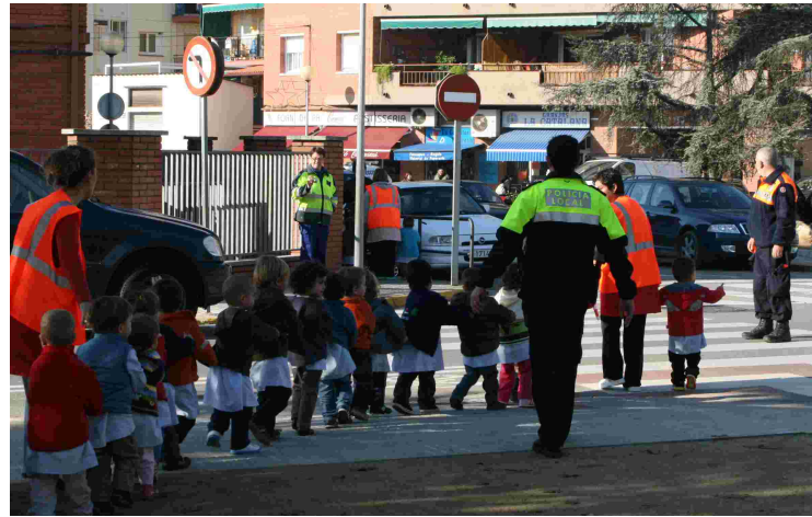
Els evacuats tornen a l'escola un cop finalitzat el simulacre

L'1 de desembre es va posar a prova la capacitat de reacció i d'evacuació de les dues escoles bressol municipals en dos simulacres d'emergències. Hi van participar la Policia Local (2 agents i 1 cotxe); Protecció Civil (3 voluntaris, 1 cotxe i 1 ambulància cedida per Grup Saps); i dos tècnics de prevenció. Els dispositius de tots ells van funcionar amb molta efectivitat.