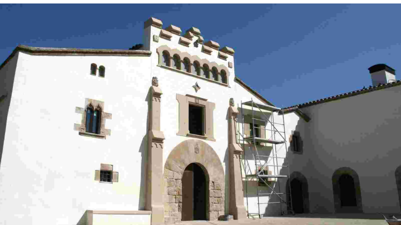
Estat actual de la Masia de Can Falguera

steri per reclamar la devolució de essos és el fet que les obres i el pagament de les factures corresponents es van fer fora del termini fixat. La reclamació podia haver estat molt més severa, ja que l'Ajuntament va rebre una altra subvenció al 2010 de 700.000€, també per a la rehabilitació de Can Falguera, i de nou les obres i els pagaments es van fer fora de termini. Finalment el ministeri no reclamarà aquests 700.000€ perquè ha concedit una pròrroga després de les gestions efectuades per l'Ajuntament i encapçalades per l'Alcaldesa, Teresa Padrós, qui va desplaçar-se a Madrid el 2 de novembre per tractar aquesta problemàtica. Les mateixes gestions són les que han fet que el ministeri permeti a l'Ajuntament que utilitzi els 300.000€ de la darrera subvenció per satisfer part de la devolució reclamada. En total el ministeri ha atorgat 1.588.000€ per a la rehabilitació de Can Falguera, però l'Ajuntament ha de retornar uns 444.000€ (300.000€ provinents de les mateixes subvencions i 144.000€ de fons propis).