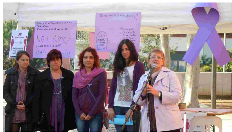
Padrós amb algunes treballadores socials de l’Ajuntament

Més de 50 persones es van reunir el 25 de novembre a la Plaça de la Vila per commemorar el Dia Internacional per a l’Eliminació de la violència envers les dones. Durant l’acte, l’alcaldessa, Teresa Padrós, va lamentar totes les víctimes d’aquest tipus de violència i va remarcar que les dones no només pateixen la violència en el seu entorn familiar, sinó que “en moltes ocasions, al lloc de feina també es pateix un tipus de violència que és més psicològica que física”.