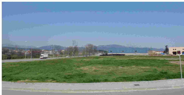
Solar on s'havia projectat la construcció del complex

L'equip de govern va aprovar en el Ple Municipal d'octubre la suspensió temporal de la construcció del complex esportiu amb piscina coberta, que havia d'arrencar a finals d'aquest mateix any. El projecte va ser aprovat per l'equip de govern anterior. El contracte signat el 20 de maig de 2011 amb l'empresa adjudicatària fixa que l'Ajuntament ha d'aportar 1.300.000 euros en els anys 2011 i 2012 (500.000 euros el 2011 i 800.000 d'euros el 2012). El cost estimat total de la construcció i posada en marxa del complex és de 5,6 milions d'euros, dels quals, l'Ajuntament haurà d'aportar 3,1 milions: 1,5 milions per començar l'obra, i uns 95.000 euros anuals durant els propers 17 anys que cobreixin el dèficit previst de l'explotació del servei.