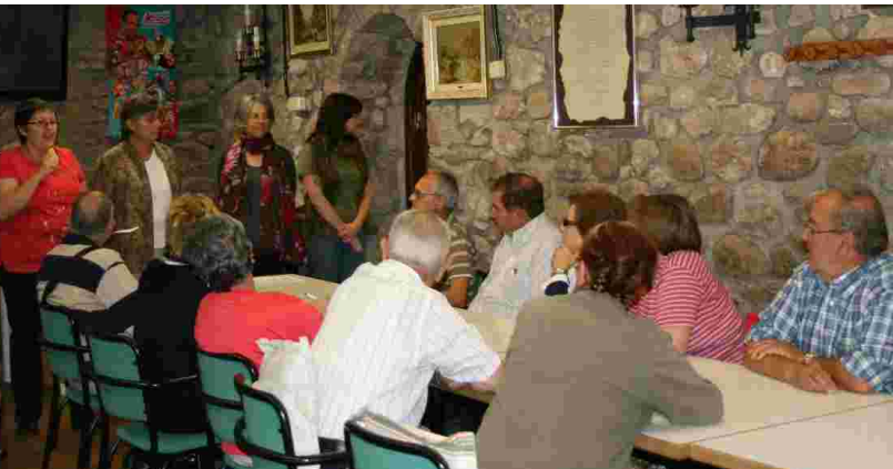
Sessió inicial del taller a Can Cortès