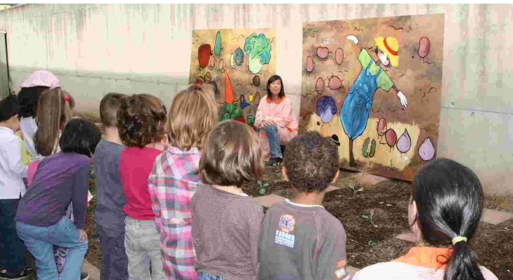
Els nens i nenes descobreixen els quadres

Els alumnes del batxillerat artístic van expressar la seva satisfacció pel fet que la seva obra resti en un indret concret, on té una funció molt clara i on pot gaudir-ne un públic tan especial. El professorat de l'institut recorda que tot i que fins ara han fet aquesta col·laboració només amb l'Escola Palau, també els agradaria crear obres per a la resta de centres del municipi.