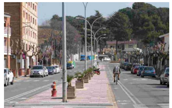
A l'av. Arquitecte Falguera s'han eliminat les peces de cautxú

En concret, s'han eliminat les peces de cautxú a l'avinguda Arquitecte Falguera, que causaven problemes per l'estretor de les calçades. Alhora es reforça la senyalització de velocitat màxima 30 km/h, en els carrers propers al carril bici. A l'av. Diagonal s'han retirat els pilons de plàstic, i al c. Folch i Torres, s'han eliminat les peces de cautxú. En aquest carrer ha estat necessari instal·lar pilons davant l'escola Folch i Torres per garantir la seguretat dels escolars i dels familiars, i en la intersecció amb l'av/ Diagonal, ja que la manca de visibilitat obliga a reforçar la seguretat. Aquestes actuacions han tingut un cost de 2.600€.