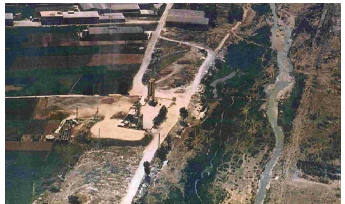
Imatge d'arxiu on es veu la gravera ocupant part del Camí Reial

L'Ajuntament va denunciar l'empresa per realitzar ampliacions de les instal·lacions sense disposar del permís municipal necessari, i el TSJC es va pronunciar a favor de l'Ajuntament i va obligar a l'empresa a desmantellar les parts que no comptaven amb la llicència municipal. El govern municipal d'aquells moments, encapçalat per l'alcaldesa Teresa Padrós, i en vista de l'incompliment d'aquesta sentència per part de l'empresa, va procedir al tancament de la instal·lació l'any 2004, i ara torna a ser el TSJC qui dona la raó al consistori perquè va actuar d'acord amb la llei.