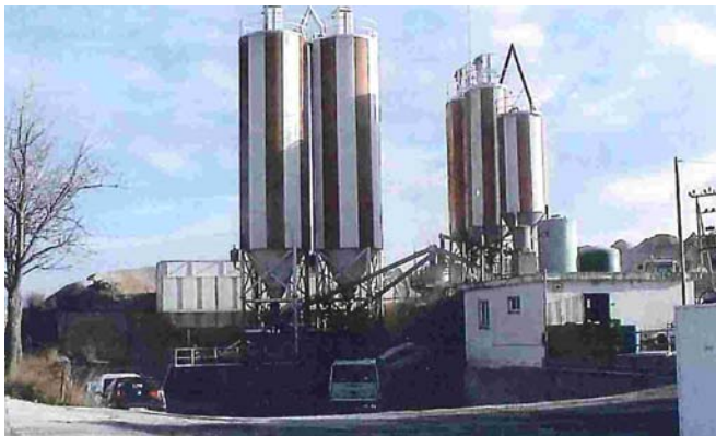
En aquesta imatge d'arxiu es pot veure com era la gravera

El tancament de la gravera va derivar de l'ampliació de la llicència d'activitats que va demanar l'empresa l'any 1996 i que l'Ajuntament va denegar al·legant que els terrenys en els que estava situada estan afectats per l'actual