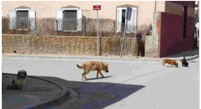
Gossos al carrer a la zona de la Sagrera

L'obligació legal de recollir de la via pública animals domèstics abandonats o perduts va costar 26.335,50€ a l'Ajuntament durant l'any 2011. Aquest cost inclou els convenis per la mantenció en centres d'acollida. El consistori en recupera una ínfima part mitjançant les taxes que han de pagar els amos quan se'ls hi retorna l'animal perquè estava perdut i no abandonat.