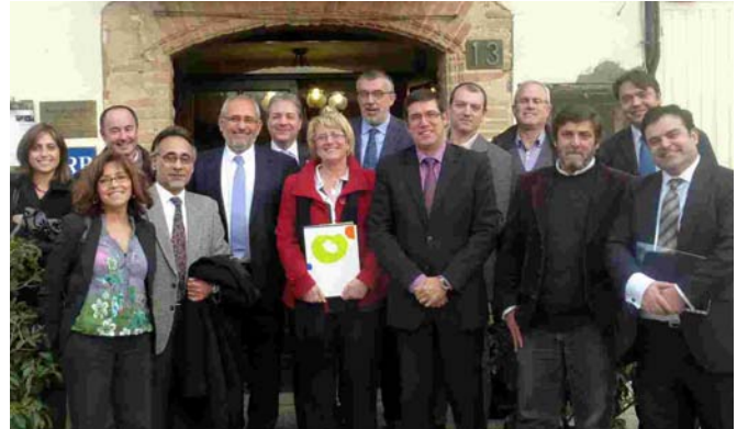
L'Alcaldesa es va reunir amb integrants de Pimec i comerciants

Segons la carta enviada pels comerciants, "tots els comentaris han estat molt positius i d'agraïment a aquest ajuntament, que sembla entendre les limitacions que tenim al poble quant a l'aparcament, que necessitem solucionar urgentment". En aquest sentit, demanen una decisió "valenta" per part de l'Ajuntament i que consideri habilitar aquests espais d'aparcament com a permanents.