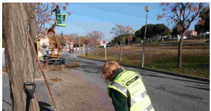
Una de les persones contractades, integrada a l'equip de Parcs i Jardins

Aquests eren alguns dels criteris de selecció instaurats pel SOC per optar a aquests als contractes del Projecte Impuls. D'entre les 61 persones preseleccionades pel SOC, l'Ajuntament va contractar-ne set, seguint diversos criteris. Pel que fa a les tasques, les tres dones s'han integrat a l'equip de Parcs i Jardins. Dos homes han estat contractats com a peons pintors, un més com a oficial de primera de paleta i el darrer com a peó de la construcció.