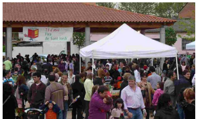
Imatge d'arxiu de la Fira de Sant Jordi a 'la Porxada'

Com cada any, es convoquen els Premis Literaris Sant Jordi, al qual hi poden participar infants, joves i adults en les categories de prosa i poesia. Les obres poden lliurar-se fins al 28 de març a la Masia de Can Cortès.