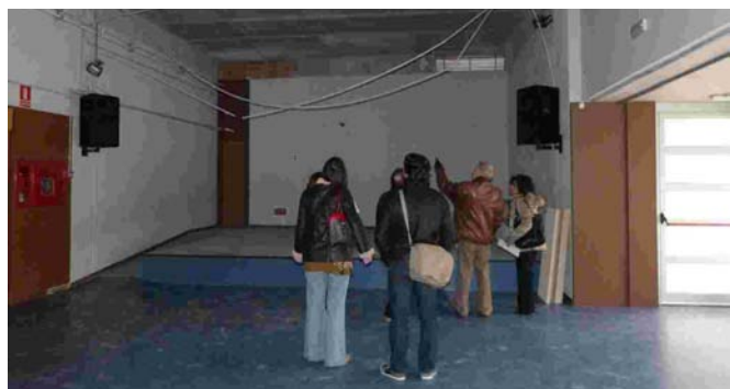
Visita al centre per conèixer les causes i les solucions

L'empresa instal·ladora ha assumit les errades i el cost de la reparació de la part caiguda. També es farà càrrec de la substitució del fals sostre que es va instal·lar de la mateixa manera a les porxadetes tot i que la Generalitat va manifestar que no hi havia cap risc de caigudes. L'Ajuntament ha fet seguiment de tot el procés des del primer moment.