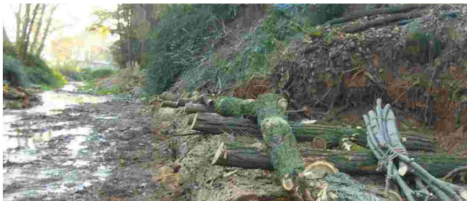
A la dreta es pot veure la creació d'un talús de protecció amb materials naturals

A més, s'ha reforçat un talús aplicant la bioenginyeria i s'han fet espigons per protegir una canalització del clavegueram que estava a la vista i que podia trencar-se en cas d'avinguda. Alhora, s'ha intervingut al gual de Sant Jaume (a prop del parc de la Sagrera), que protegeix una altra canalització del clavegueram. A banda de reforçar el gual, s'hi han col·locat barreres per evitar el pas de vehicles i la conseqüent pressió sobre el gual i la claveguera. Ara només es permet el pas de vehicles d'emergència.