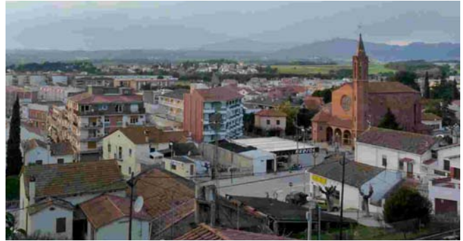
Una part important dels immobles de la vila es pot veure afectada per l'increment de l'IBI

En el moment de tancar aquesta edició, ni el Ministeri d'Hisenda ni la Diputació de Barcelona han dictaminat resolucions que indiquin a quines propietats s'ha d'aplicar la pujada extraordinària de l'IBI que ha decretat el govern de l'Estat. A causa d'aquesta indefinició, l'Ajuntament ha decidit posposar el cobrament de la primera fracció de l'IBI que havia de fer-se efectiu l'1 de març per als propietaris que han domiciliat el pagament. El consistori preveu cobrar aquesta primera fracció al mes d'abril, sempre que s'aclareixin les contradiccions detectades al decret.