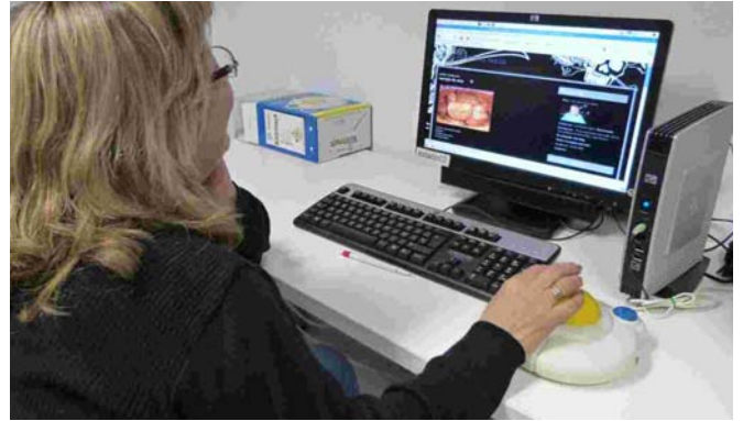
Una usuària prova un dels models de ratolins adaptats

El Punt TIC de la vila s'ha incorporat al projecte TocTac, que vol promoure l'accessibilitat de totes les persones a les noves tecnologies. La Xarxa de Telecentres de Catalunya ha prestat ratolins i teclats adaptats al Punt TIC palauenc amb la finalitat que els seus usuaris els coneguin i sàpiguen que poden ajudar-los en utilitzar l'ordinador.