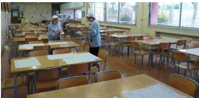
L'Ajuntament ha incrementat els recursos destinats a beques de menjador