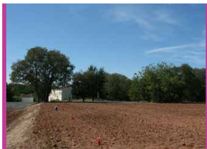
S'estan adequant els camps de Can Boada.

L'Ajuntament ha hagut de trigar més temps del previst per convocar el sorteig per diverses raons. El projecte de creació dels Horts Municipals el va iniciar el govern de l'anterior mandat (2011-2015). El reglament es va aprovar a finals d'agost del 2014. Amb tot, per condicionar els camps calia esperar a l'aprovació definitiva del Pla d'Ordenació Urbanística Municipal (POUM), que va succeir el 23 d'abril del 2015. En aquest punt es va optar per no engegar el concurs per no incomplir les limitacions legals vigents en períodes electorals. Un cop celebrades les eleccions del 24 de maig i constituït el nou govern municipal, és quan s'ha pogut continuar amb el projecte i convocar el sorteig.