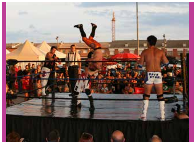
Gran Espectacle Wrestling.

Fancon 2015 ha comptat amb un pressupost de 15.000€, 9.000€ dels quals han estat aportats per l'Ajuntament. L'epicentre del festival ha estat el Pavelló Municipal d'Esports Maria Víctor i el seu entorn. És on s'han ubicat els expositors, les taules de joc i bona part de les exhibicions. El Teatre de la Vila ha acollit el Festival de Cinema Fancon. Els instituts Ramon Casas i Marinada han estat l'escenari de jocs de rol en viu i de taula, mentre que el Castell de Plegamans ha estat el marc medieval de diversos concerts.