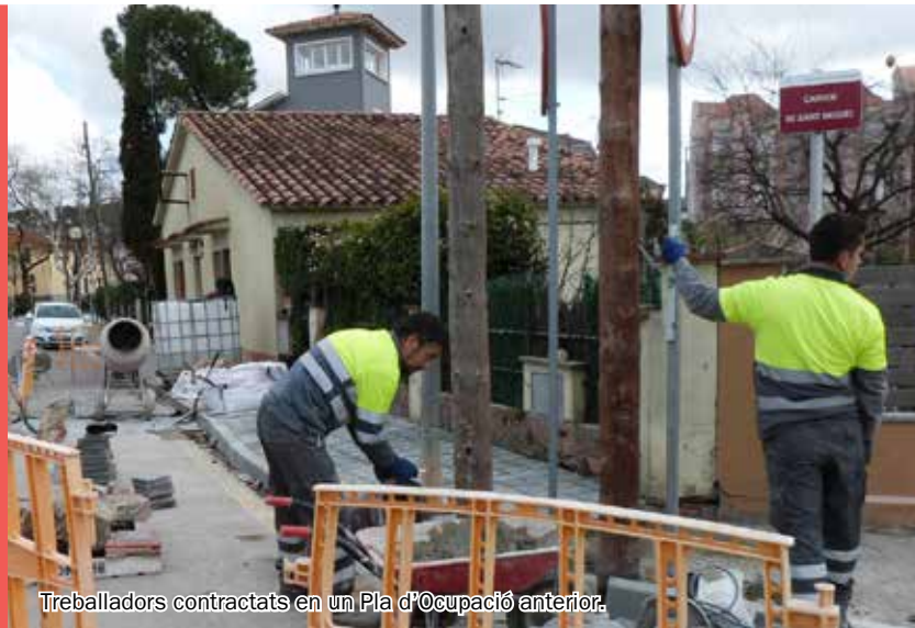
Treballadors contractats en un Pla d'Ocupació anterior.

Els interessats han d'estar inscrits a l'oficina del SOC de Sabadell abans de l'inici del procés de selecció