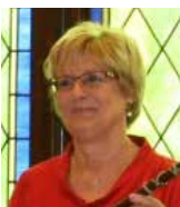
Teresa Padrós, Alcaldessa

“Estic contenta de veure que totes les persones que formen l'equip de govern tenen moltes ganes de treballar”