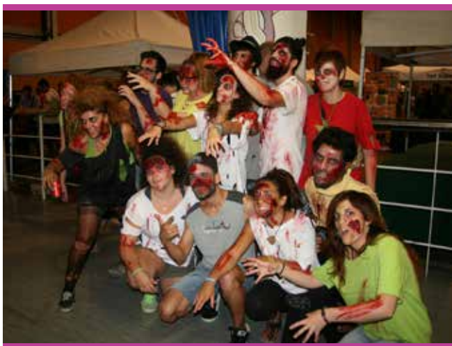
Membres de la Batucada Zombie.