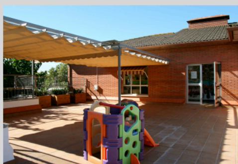
IMPERMEABILITZACIÓ I ADEQUACIÓ TERRASSA

La tècnica auxiliar d'educació comenta que pel que fa a la impermeabilització de la terrassa de l'E.B. Patufet hi ha hagut un cost de 30.357,69 €, i que a l'any vinent es continuarà amb el canvi de paviment a les dues escoles i també es mirarà de posar nous arrambadors a l'E.B. Patufet.