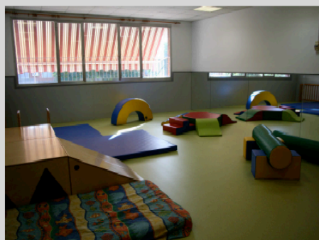
SALA DE PSICOMOTRICITAT (CANVI DE PAVIMENT I MUNTATGE D'ARRAMBADOR )