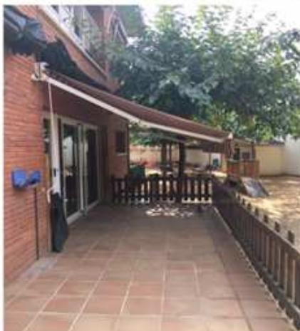
Canvi tendal Patufet