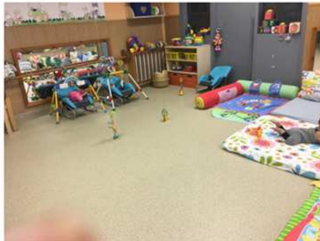
Canvi tendal Patufet