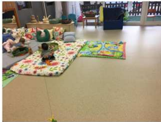
Canvi de paviment aula nadons